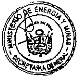
GONZALO TAMAYO FLORES Ministro de Energía y Minas